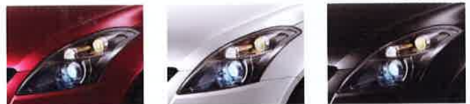
Ablaze Red Pearl (ZTW) Snow White Pearl (ZTR) Super Black Pearl (ZTT)

* สีของรถปรากฏในภาพแตกต่างจากสีจริงเนื่องจากกระบวนการพิมพ์